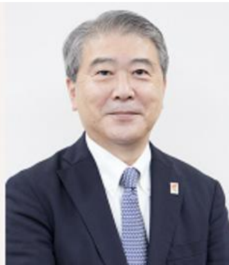
「兜町カタリスト」編集長